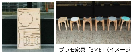
プラモ家具「3×6」(イメージ)